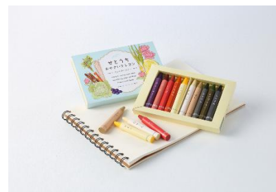
◇ 準グランプリ せとうちおやさいクレヨン