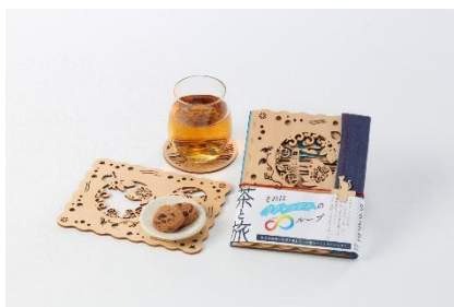
◇ 準グランプリ 茶と旅