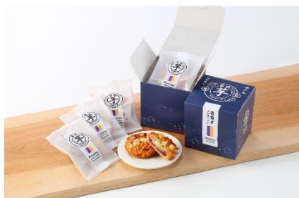
◇ グランプリ 番田芋フロランタン